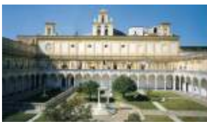
La Certosa di San Martino

Il giorno 18 dicembre, le classi terze hanno partecipato all'uscita didattica a Caserta per la visione di un musical in lingua inglese e la visita della Certosa di San Martino a Napoli. Lo spettacolo intitolato "The Fame" è stato recitato da attori di lingua madre inglese. È la storia di un gruppo di ragazzi che, con le loro capacità, riescono ad entrare, superando una serie di provini, in una scuola in cui fanno maturare i loro talenti per diventare famosi. Al fine della carriera scolastica il loro carattere e il loro modo di vivere saranno totalmente diversi. Al termine dello spettacolo gli attori hanno dato la possibilità di partecipare a una specie di "concorso" in cui i ragazzi, ponendo loro delle domande, potevano vincere una maglia